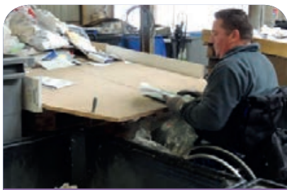
Activité de tri et de valorisation de papier de bureau.

HANSEMBLE est l'interlocuteur privilégié de la DIRECCTE et de l'ensemble des