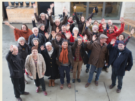
AG Constitutive de TDL Nouvelle-Aquitaine

Préserver les terres agricoles, les protéger de la spéculation foncière, accueillir des porteurs de projets soucieux d'une production alimentaire saine et respectueuse de l'environnement, permettre l'installation de fermiers acteurs de leur territoire, voilà ce dont nous avons envie ! Et ce pourquoi nous agissons localement : par le partage d'argent, pour acheter des fermes, et d'huile de coude pour y réaliser des chantiers participatifs, par l'échange d'informations sur les stands communication ou autour d'une tasse de café lors de la mise sous pli de ce Ligam... Notre engagement citoyen local témoigne que TDL n'est pas un mouvement "hors sol". Néanmoins, les représentations régionale et nationale me paraissent tout aussi indispensables pour porter plus fort encore ce message, le rendre audible par le plus grand nombre - notamment nos élu-e-s, les décideurs politiques - et tenter d'infléchir, à la mesure de nos moyens, les règles d'utilisation du bien collectif qu'est notre terre nourricière.