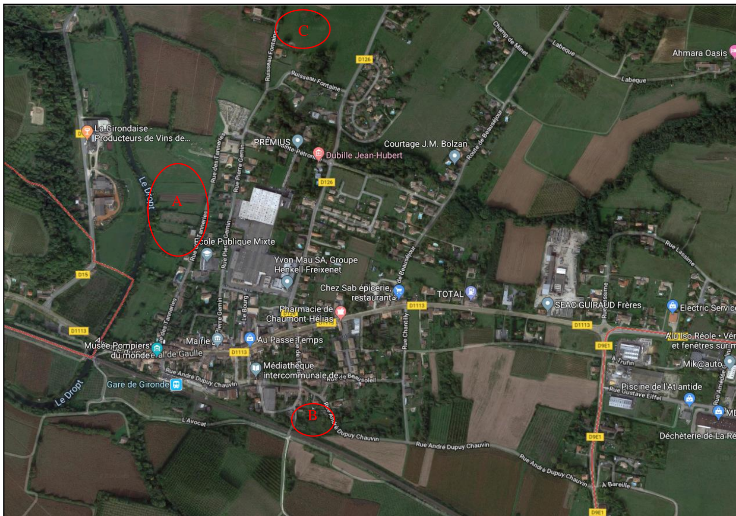
Parcelle B Beausoleil (2 ème et 3 ème catégorie de fermage) Parcelle C Fillotte (2 ème de fermage)