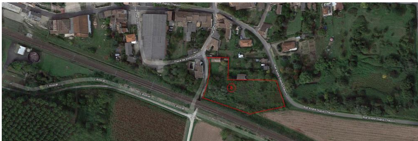
Parcelle B Beausoleil