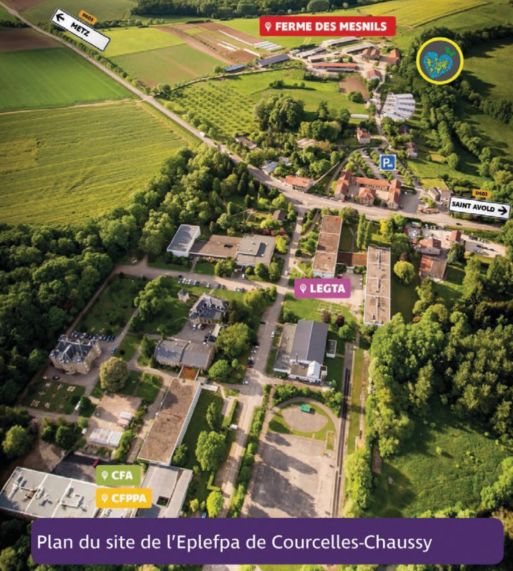
Plan du site de l'Eplefpa de Courcelles-Chaussy

Le Forum se tient sur le site de la ferme des Mesnils.